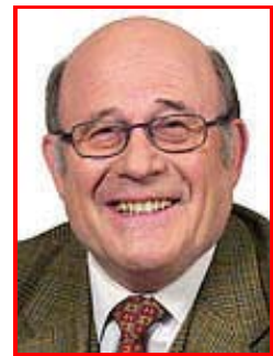
Dr. Wolfgang Bötsch

Bundesminister für Post und Telekommunikation a. D.